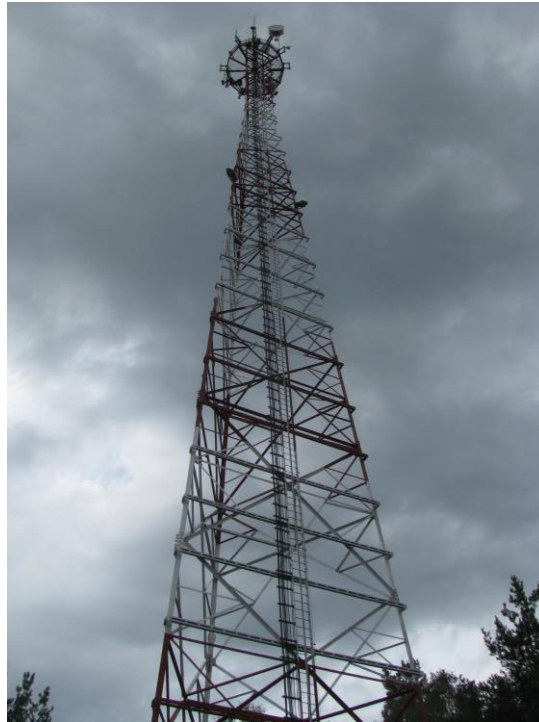
Zaf. nr 1: Widok ogólny instalacji radiokomunikacyjnej.